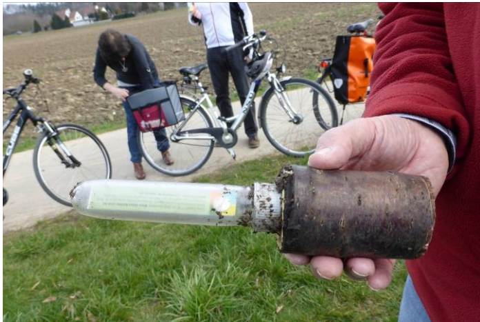
Ein gefundener Geocache in Menden-Halingen