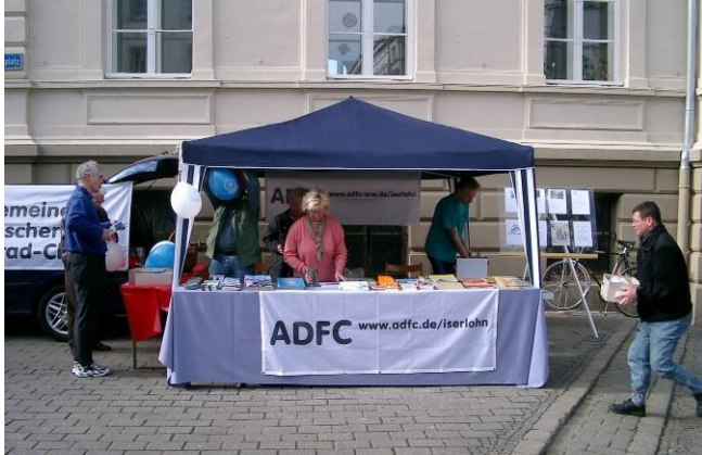
Alter Rathausplatz