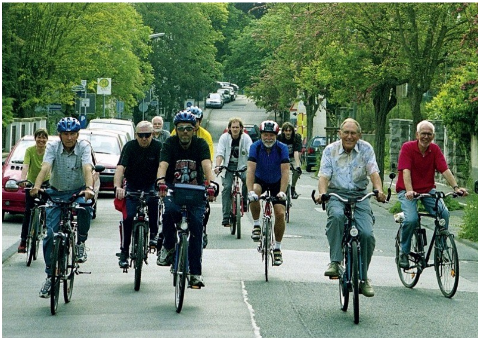
Foto: Stadt Iserlohn, Sozialamt (aus: Senioren in Iserlohn, Stand: Juni 2001)