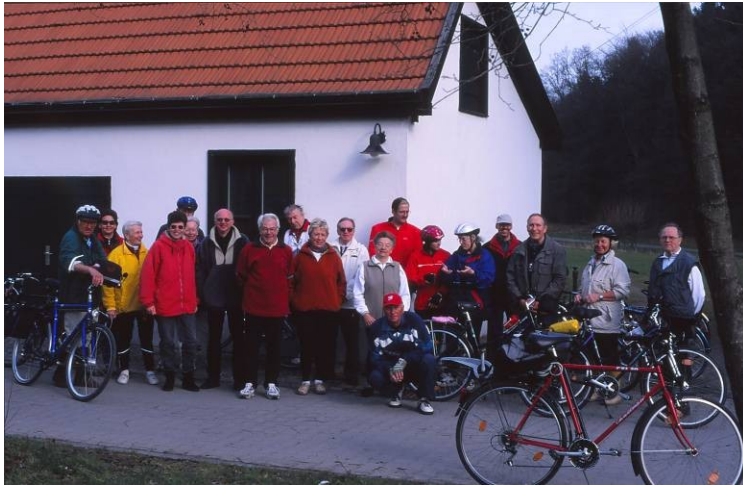
Museumsdorf Barendorf

Barendorf: Anradeln nach Menden ins Bibertal (20°C und Sonnenschein/etwa 50 km) (Mendener Zeitung 19.03.2002, IKZ 20.03.2002)