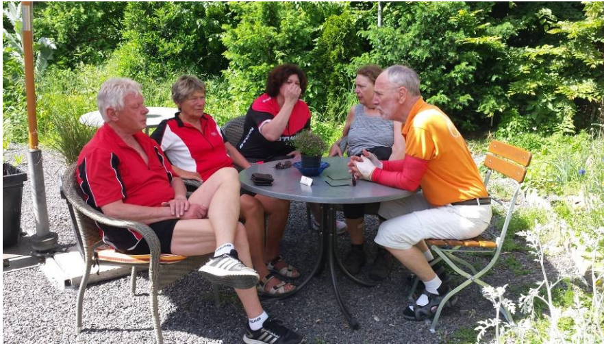
Einkehr im Halinger Hof