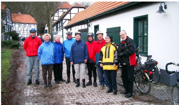
Museumsdorf Barendorf

Barendorf: Sternfahrt "Jubiläum Kaiserroute" [10 Jahre] nach Schwerte, Treffen anderer ADFC-Gruppen in Geisecke, Länge der Tour 30 km, Tourenleiter: Werner Kroll (IKZ 24.03.2004)