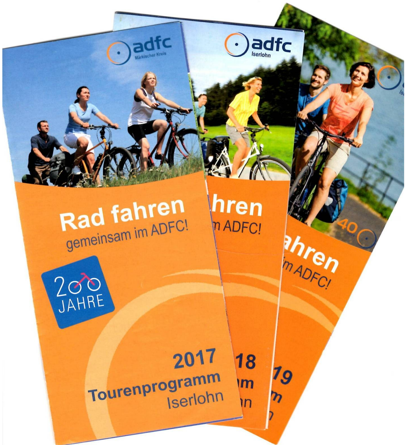
Tourenprogramm: Neues Design ab 2017