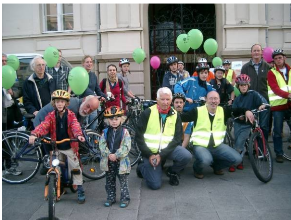
Alter Rathausplatz

( Info M. Goebel, Jugendreferat des ev. Kirchenkreises Iserlohn / IKZ 27.09.2011 )