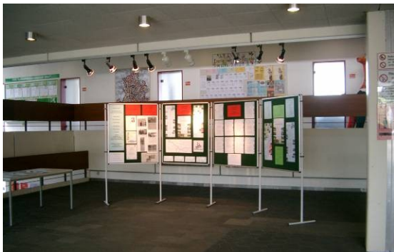
Im Rathausfoyer

Iserlohn, Rathaus I: Ausstellung zur Eröffnung der Lenneroute