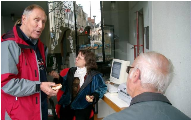
Im Eingang der Stadtbücherei