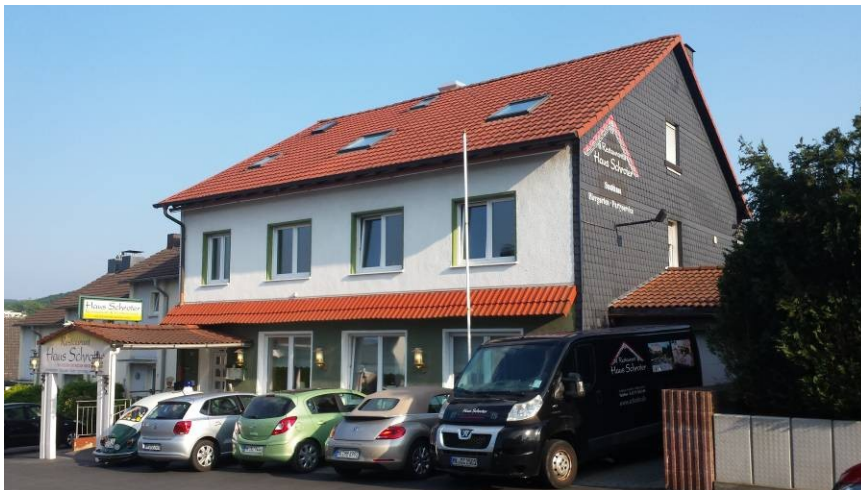
Haus Schroter