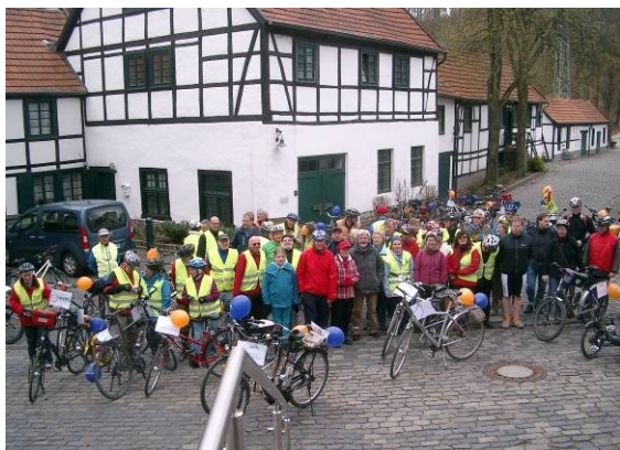
Pause in Barendorf (Nr. 3)