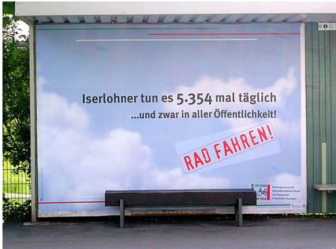
Bushaltestelle Wichernhaus am Dördelweg

Iserlohner tun es 5354 mal täglich ... und zwar in aller Öffentlichkeit (Werbekampagne)