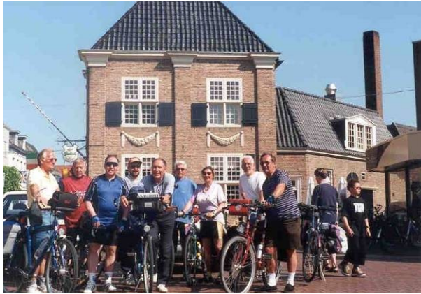
In Almelo